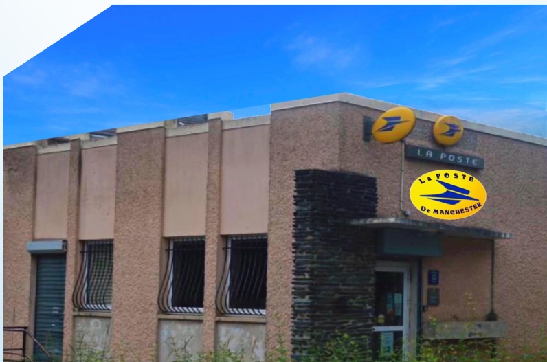
Cette photo représente la Poste de Manchester qui n'est plus en activité et où les travaux sont actuellement en cours pour la futur Maison France Service .

L'équipe rédactionnelle de notre journal a voulu mettre en avant ce grand projet car c'est l'un des plus importants pour cette nouvelle année. Les habitants y trouveront de nombreux services comme une permanence des travailleurs sociaux du CCAS, un conseiller numérique pour les démarches en ligne, une permanence de la Police Municipale qui au passage est déjà présente sur le quartier depuis un petit moment, une prise en charge pour les dossiers de carte nationale d'identité et passeport).